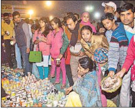
गांधी मैदान में लगे सरस मेला के समापन के दिन स्टॉल पर खरीदारी करते लोग।