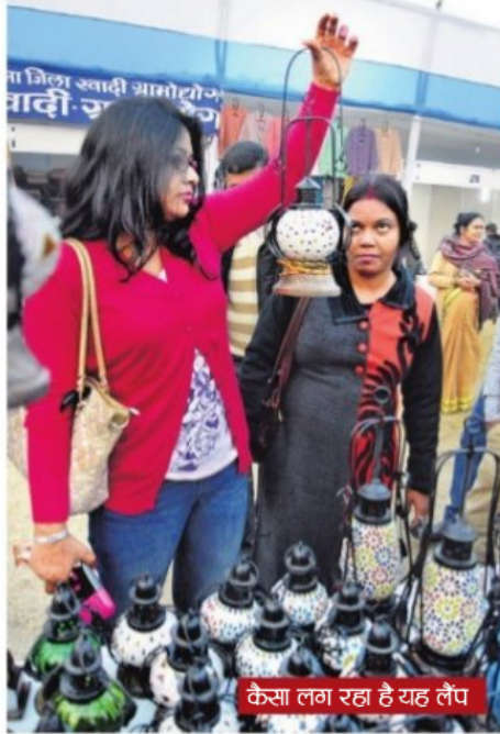
केसा लग रहा है यह लैप

मेले में कुल 303 स्टॉल हैं, जिसमें सभी स्टॉल में कुछ खास देखने को मिल जायेगा. यहां सस्ती चीजों के साथ-साथ महंगे सामान भी मिल रहे हैं. इसमें सहारनपुर का बना महाराजा सोफा हो या लकड़ी का फ्लावर पॉट या फिर झूला,