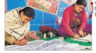
सरस पॉटिंग शैली: