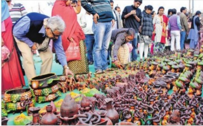
मेले में टेराकोटा के सामान को देखते लोग.

वैसे, तो सरस मेले में हर दिन भीड़ होती है, लेकिन संडे के दिन छुट्टी होने की वजह से लोग रिलैक्स हो कर शॉपिंग कर रहे थे. इसलिए यहाँ एक लाख से ज्यादा लोग पहुंचे. मेले में हर उम्र के